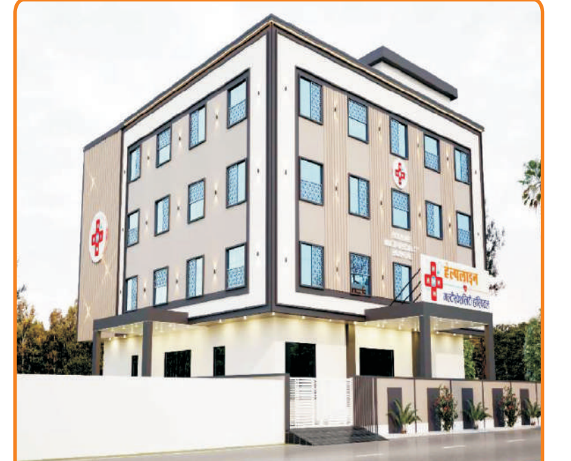
Helpline Multispeciality Hospital Kishangarh