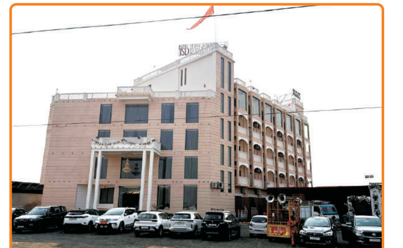
Hotel Dwarika Baran