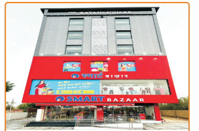
The Ratan Elite Bijaynagar

प्रधान कार्यालय : 2343 द्वितीय तल, वैशाली नगर, अजमेर (राज.) Visit us at brkgb.com