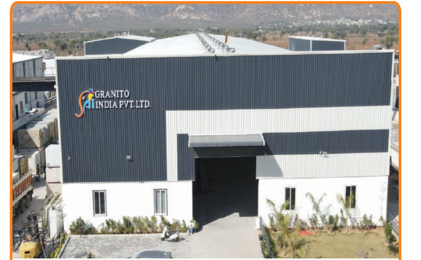
Sai Granito Kishangarh